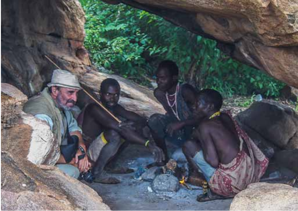
FIGURA 4.—El autor con un grupo de bosquínianos de la tribu Hadza (Tanzania).

hace 9.000 años se domesticó en Oriente Medio primero la cabra, luego la oveja, más tarde la vaca, el camello, el asno y el caballo, para acabar finalmente dominando a los cereales, principalmente el trigo, y lo que fue más cruel, a otros humanos, a los que se esclavizó como mano de obra. Y en Asia con el arroz y en América con el maíz sucedieron procesos similares.