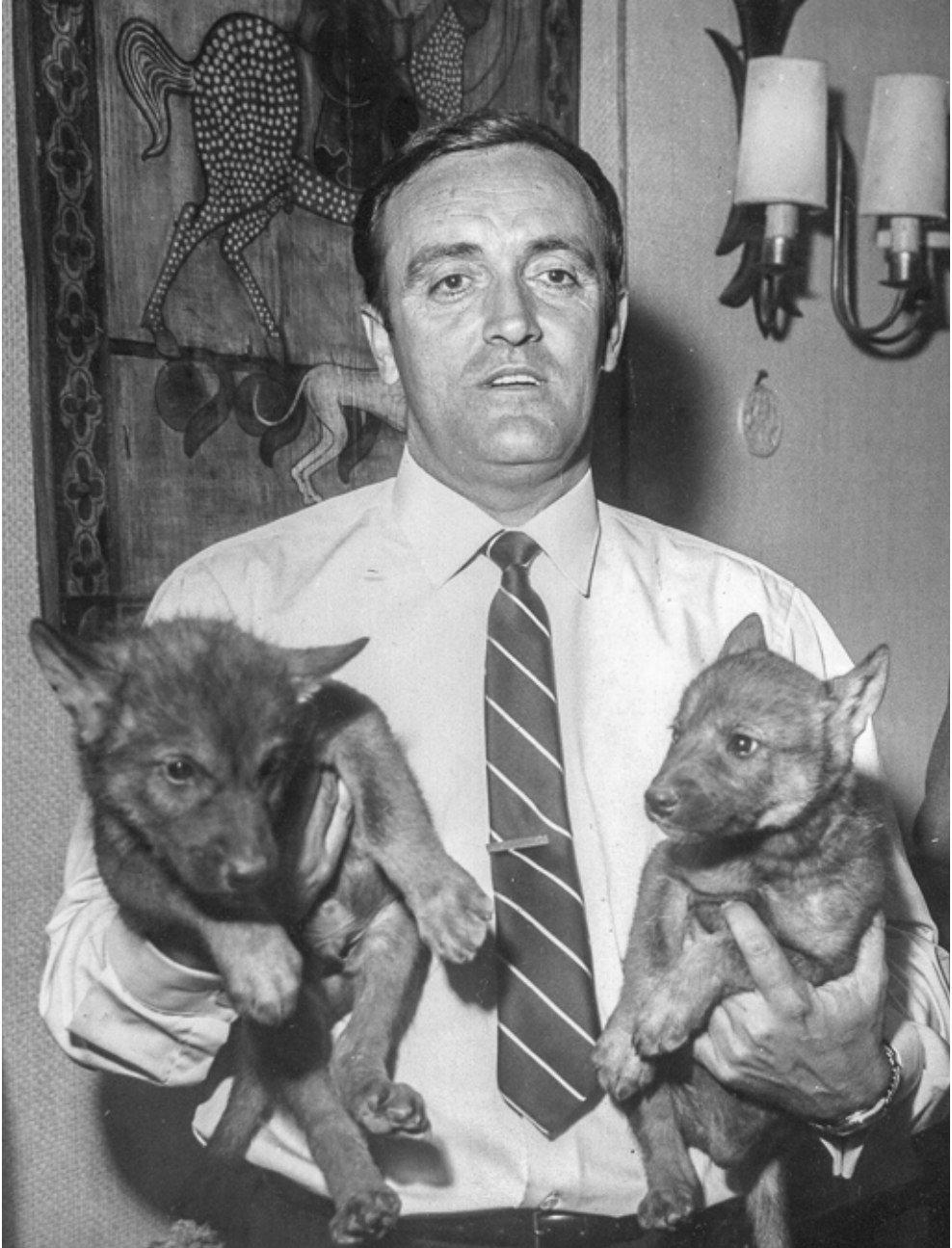
FIGURA 5.—Félix Rodríguez de la Fuente presentando en sociedad (1965) a los cachorros de lobo Remo y Sibila.