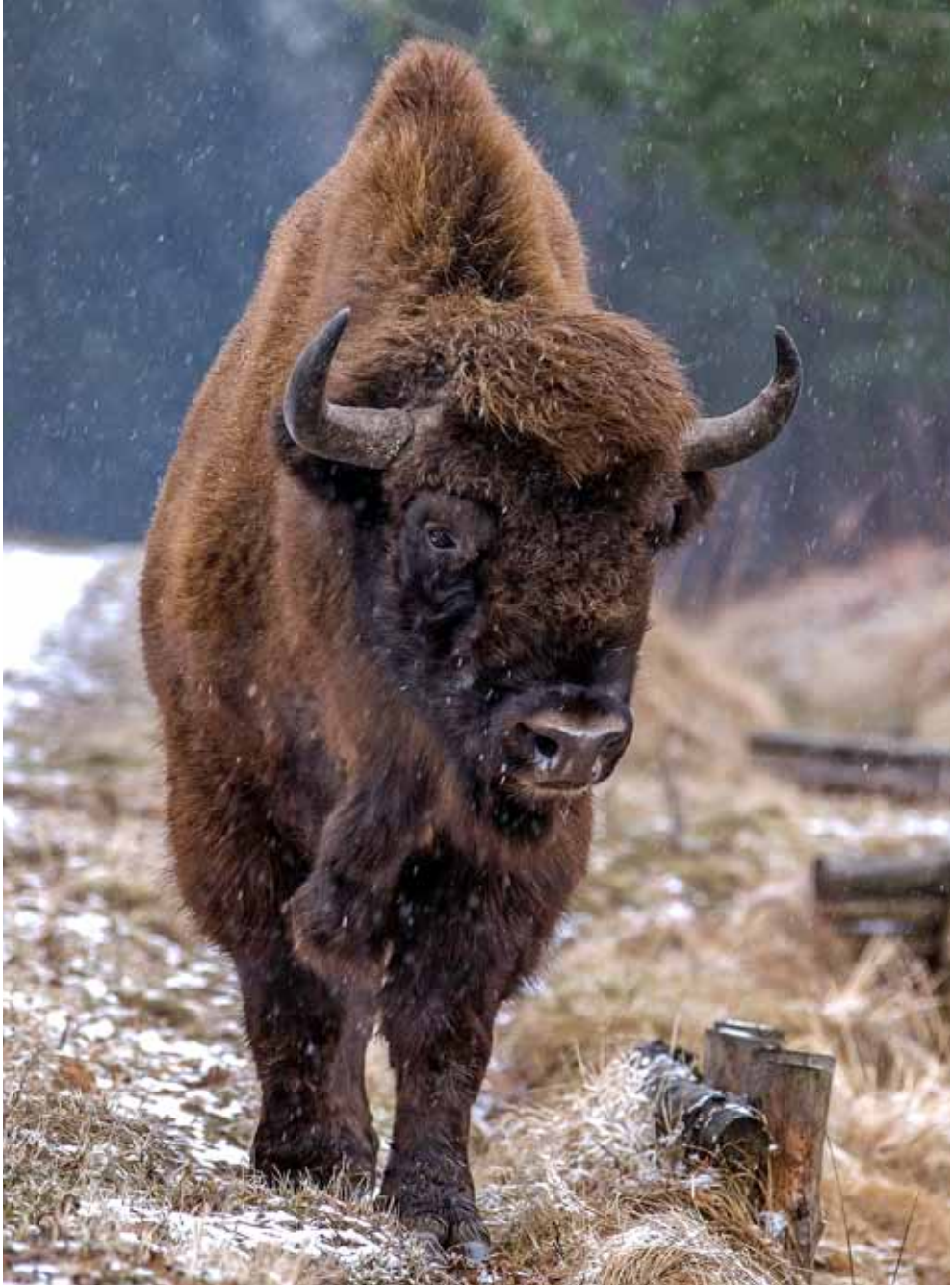
FIGURA 3.—Bisonte europeo.