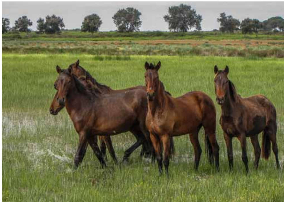
FIGURA 7—Caballos de «retuerta» de la Estación Biológica de Doñana, Huelva, (cortesía del autor).

que se mezclaron más recientemente con el sustrato de España «de toda la vida» fue más cultural que genética, al no ser relevantes numéricamente respecto a la población aborigen de H. sapiens asentada en Iberia desde hace unos 40.000 años.