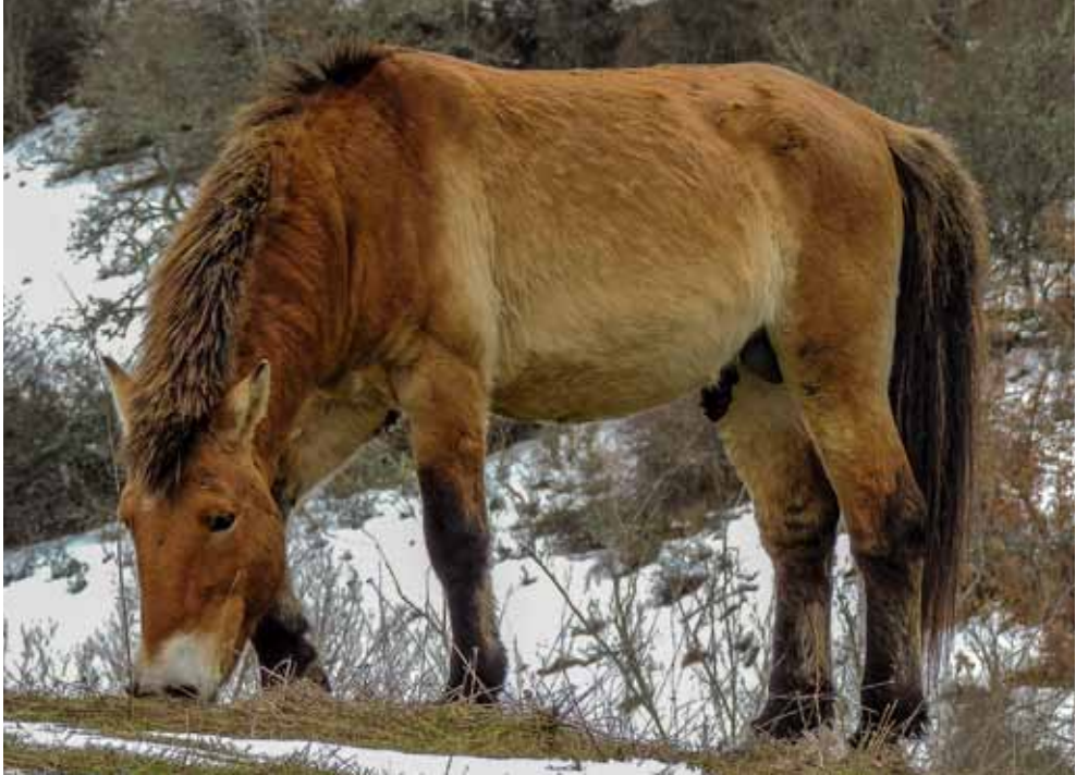
FIGURA 2.—Caballo de Przewalski o caballo salvaje mongol.

hasta ser una de las áreas más deshabitadas de Europa y donde la media de edad de sus habitantes permanentes ronda, cuando no supera, los 65 años. En sus frondosos hayedos se mató el último oso hacia 1940. El lobo aún vive en la sierra y en 2013 se dio en la parte burgalesa un cupo para matar seis ejemplares de una población cuyo censo exacto no se conoce.