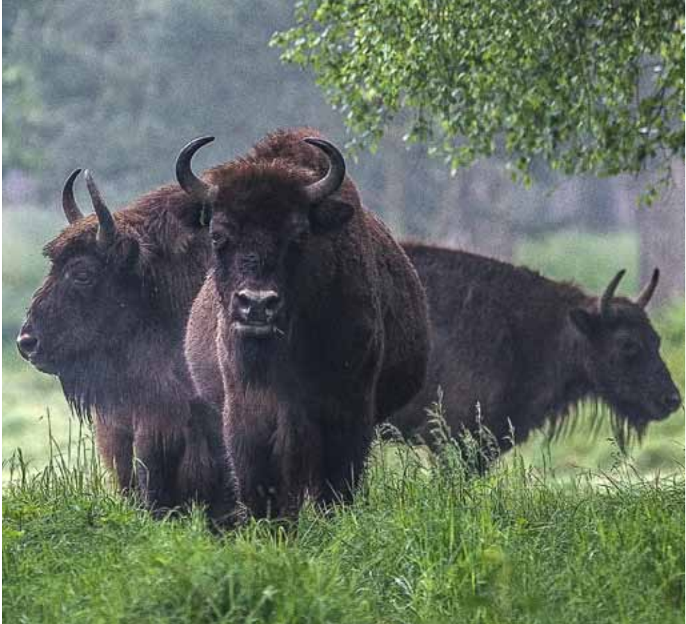
FIGURA 6.—Grupo de bisontes europeos.

ganaderas, lo mismo debiera acometerse cuanto antes con la política de conservación de la Naturaleza: hay que rediseñarla por completo.