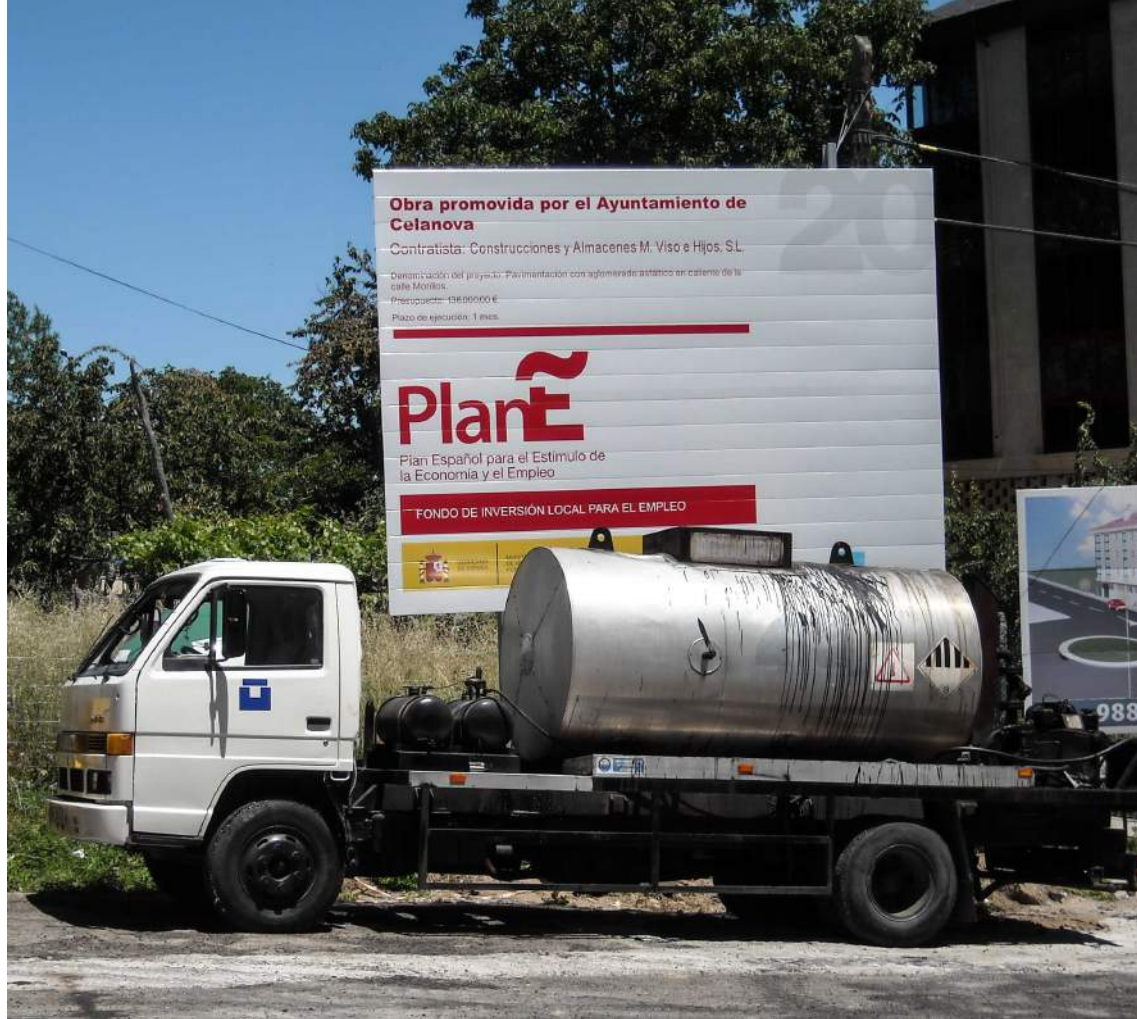
Pavimentación de una calle en Celanova (Orense) con fondos provenientes del controvertido «Plan E» de 2009

individuos. Sin embargo, las cifras globales sobre riqueza arrojan datos sorprendentes y alejados de esa realidad. Según el Banco de España, el ahorro financiero (depósitos, fondos de inversión o acciones) de los hogares españoles alcanzó a finales de marzo de 2015 los dos billones de euros, la cifra más alta de la historia. En un país en el que la tasa de ahorro ha caído, este hito no habría sido posible de no ser por el efecto que ha tenido en la riqueza neta la reducción de los pasivos (obligaciones de pago) de las familias. En estos años, los hogares no sólo han ido amortizando los créditos hipotecarios de la época del boom sino que han dejado de pedir nuevos préstamos.